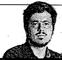
ESTA COLUNA É PUBLICADA ÀS SEGUNDAS, QUINTAS E SEXTAS